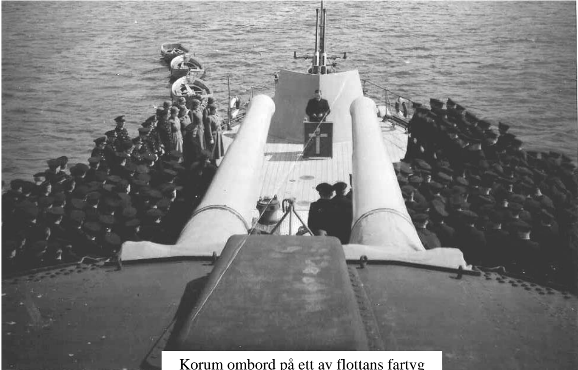
Korum ombord på ett av flottans fartyg

Konung Gustav VI Adolf samtalar med Allan ombord på kryssaren Göta Lejon på väg till statsbesök i Helsingfors 1952.