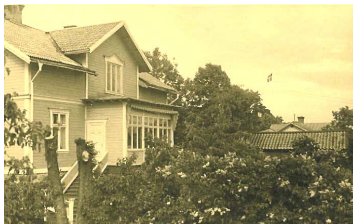
Dalarö prästgård på 1930-talet