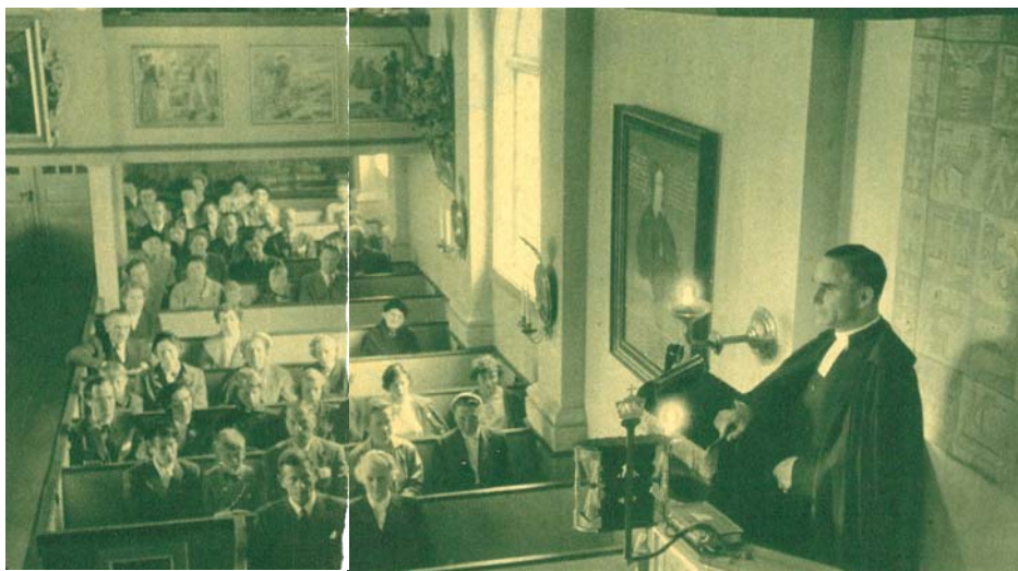
Gudstjänst i Dalarö Kyrka