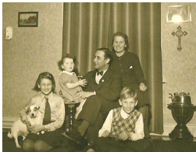
Hela familjen samlad 1940