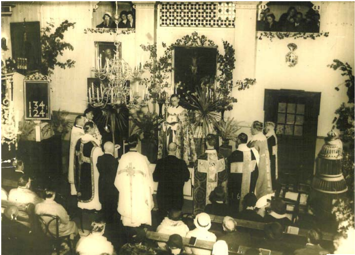
Installationen till Kyrkoherde i Dalarö, Ornö och Utö församlingar 1933